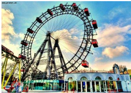
Das Wiener Riesenrad